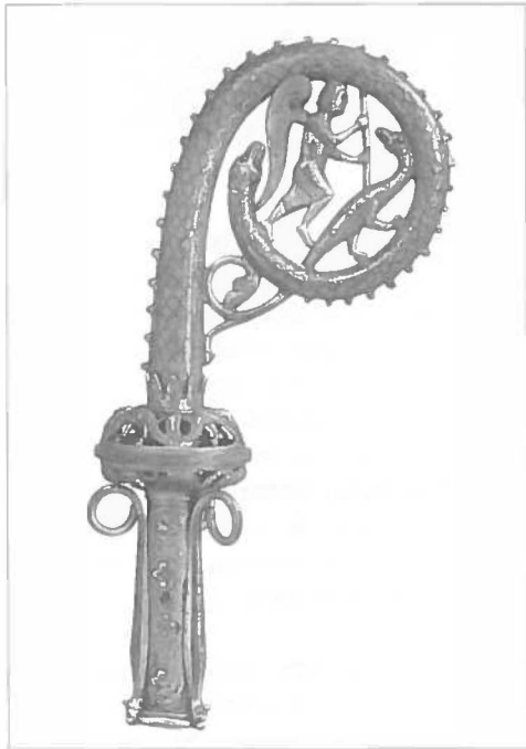
Bisschopsstaf, St.-Michael en de draak. Limoges, Frankrijk. Eind 12e, begin 13e eeuw.