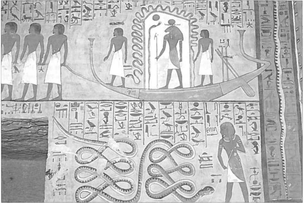
Slang op het graf van farao Ramses I, 1135 v. Chr.