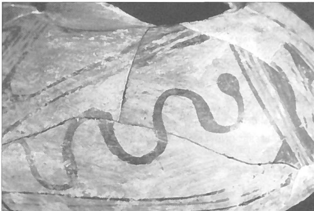
Geschilderde slang op een vaas uit de eerste helft van het vierde millennium voor Christus. Uit: Gimbutas, The goddesses and gods of old Europe. Myths and cult images. London, 1982, pagina 97.

Aboriginals, West-Europeanen enz., stuit bij herhaling op slangen die er een bijzonder vooraanstaande rol in spelen. Hun geheimzinnige manier van tevoorschijn kruipen en verdwijnen is in veel culturen in verband gebracht met magie, geesten, zielen, voorouders en de onderwereld; de slang symboliseerde, en symboliseert nog, onsterfelijkheid, oneindigheid, onafgebroken vernieuwing van het leven, seksualiteit, vruchtbaarheid. Voor- en tegenspoed van mensen en steden hingen af van het wel en wee van deze speciale 'beschermengelen'. Zelfs het leefbaar zijn en blijven van streken, ja van hele landen waar periodiek grote droogten heersten, hing van haar af, daar haar regenmakerskwaliteiten toegedicht werden: indianen hebben de snelheid waar-