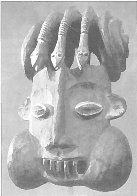
Houten slangmasker. Cameroen, 19e-20ste eeuw. Uit: Nissenson & Jonas, pag. 31.

De fascinatie van de vroegste mens voor de slang zal mede veroorzaakt zijn door de macht over leven en dood die zij bezat. Het toeslaan van met name een gifslang is met het blote oog nauwelijks te volgen. De wond die ze toebrengt is vaak onzichtbaar of onooglijk, maar de gevolgen ervan zijn al heel snel voelbaar en veelal rampzalig van afloop.