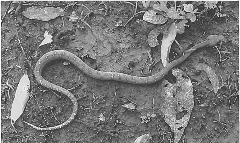
Corallus caninus uit Panguana, oost Peru in jeugdkleed. Dit dier werd op de grond aangetroffen.

Het boek heeft een A5-formaat. Als men de ruimte die in beslag genomen wordt door de foto's (gemiddeld meer dan één per pagina), algemene (bekende) informatie en literatuurverwijzing (13 blz.) van de totale inhoud aftrekt, blijft er m.i. te weinig over om de prijs van $33,- te billijken, ondanks de prachtige foto's en goede informatie.