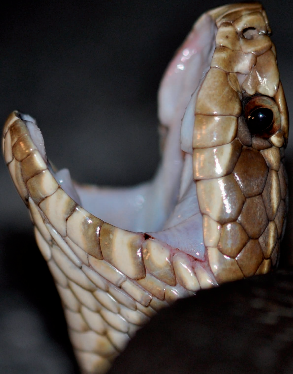
Watermoccasin ( Agkistrodon piscivorus ). Okefenokee Swamp Park, Waycross, Georgia, 2018. Cottonmouth ( Agkistrodon piscivorus ). Okefenokee Swamp Park, Waycross, Georgia, 2018.